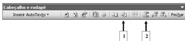
Figura 1 – Barra do Cabeçalho e rodapé do Word 2003

37. Em relação ao Word 2003 e com base na Figura 1 e nas informações nela contidas, como são chamados os ícones de números: 1 e 2, respectivamente?